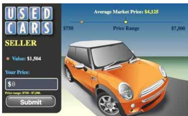
Рис. 1. Сторінка ухвалення рішення щодо ціни, яку покупець готовий заплатити за автомобіль

Найефективнішим буде проведення практичного заняття у формі тренінгу для студентів, що одночасно є працівниками організацій або беруть участь у виконанні практичного проекту в групах. У такому разі посилюється вплив власного досвіду на міру усвідомлення наявності проблеми та зростає мотивація для її вирішення. Практичний досвід показує недостатню готовність безпосередніх керівників та співробітників до надання негативної оцінки професіоналізму та продуктивності підлеглих і колег. У такій ситуації наявна спроба уникнути потенційного конфлікту з колегою та відповідальності щодо дій адміністративного та фінансового характеру стосовно колеги. Помілково враховується позитивний ефект надання змоги колезі виправитися самостійно, але не враховується ефект, притаманний ринкам з асиметричною інформацією, щодо усереднення фінансової винагороди та тенденції до звільнення кращих (у цьому разі – недооцінених) працівників.