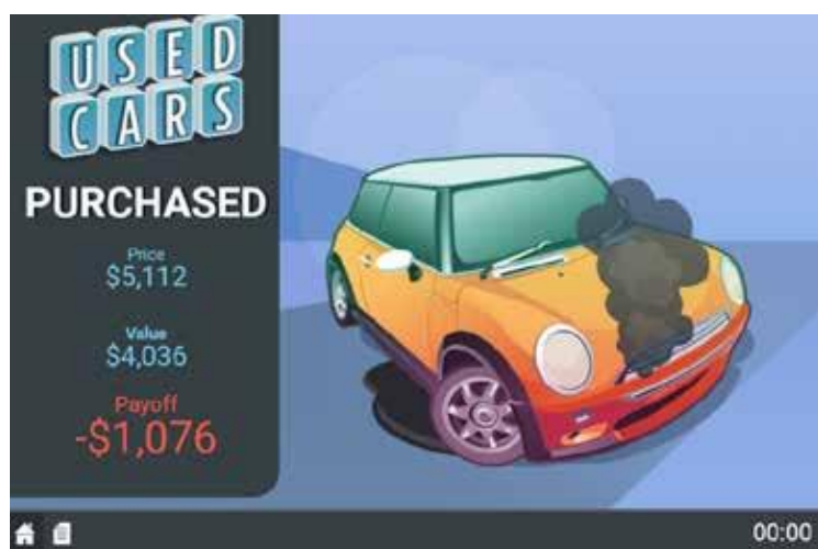
Рис. 3. Негативний результат угоди для продавця

У ситуації, коли цінність автомобіля для покупця виявилася нижчою за ціну купівлі, результат для покупця вважається негативним (див. рис. 3).