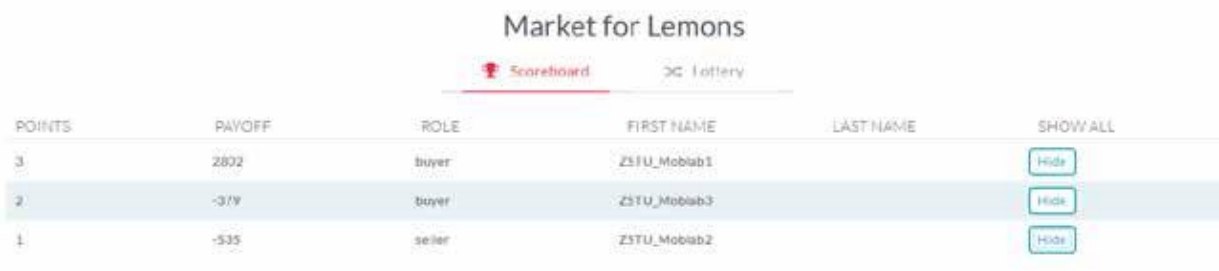
Рис. 5. Сторінка результатів проведення симуляційної сесії

Після завершення чергової симуляційної сесії викладач має змогу ознайомитися з результатами та показати їх студентам, для чого потрібно перейти за посиланням "Scoreboard". Результати проведення тренувальної сесії відображено на рис. 5.