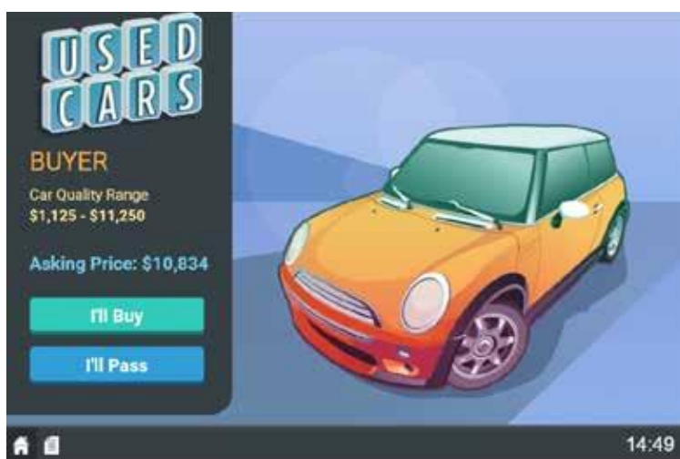
Рис. 2. Інтерфейс симуляції для ролі "покупець" у процесі ухвалення рішення щодо доцільності придбання автомобіля за запропонованою ціною

За умови вибору варіанта погодитися на ціну, запропоновану продавцем, і купити автомобіль покупець має змогу отримати позитивний результат у ситуації, коли цінність автомобіля (реальна вартість автомобіля для продавця, помножена на коефіцієнт "Beta", як зазначалося в процесі налаштування умов симуляції викладачем) для покупця вище за ціну, що він за нього заплатив. У такому разі, за умови ціни купівлі нижчої за цінність автомобіля для покупця, покупець отримав виграш.